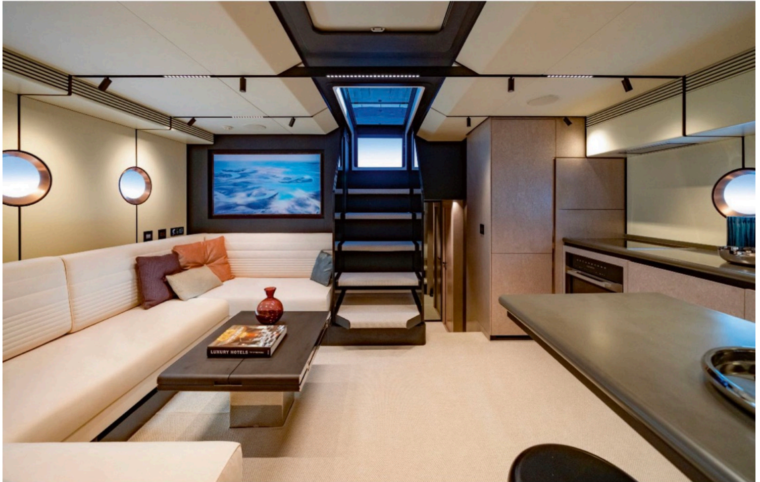
Warmes Ambiente: BurdissoCapponi Yachts&Design schufen mit der „Cool“-Variante ein Interieur mit Wurzelholz furnier als Leitmaterial

riears wider und verstärken die heute so wichtige Verbindung zwischen Innen und Außen. Vervollständigt wird das Cockpit von einer Galley mit Fenix-Becken auf der Steuerbordseite neben dem Steuerstand. Die Außenküche ist vollständig integriert und mit Eismaschine, Kühlschrank, Grill sowie zwei Kochfeldern ausgestattet, um auch bei längeren Aufenthalten an Bord kulinarische Vielfalt zu gewährleisten.