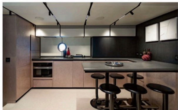
Wohnküche: Der Salon mit Küchenzeile und Speisetresen im amerikanischen Stil dient bei schlechtem Wetter als Rückzugsort.

für das etwas schwächere Motoren-Trio mit je 588 Kilowatt Leistung, das den in Vakuuminfusion laminierten GFK-Gleiter immer noch mit 35 Knoten durch die Wellen preschen lässt. Bei einer Reisegeschwindigkeit von 25 Knoten reichen die 3.820 Liter Diesel im Tank für eine Reichweite von 350 Seemeilen,