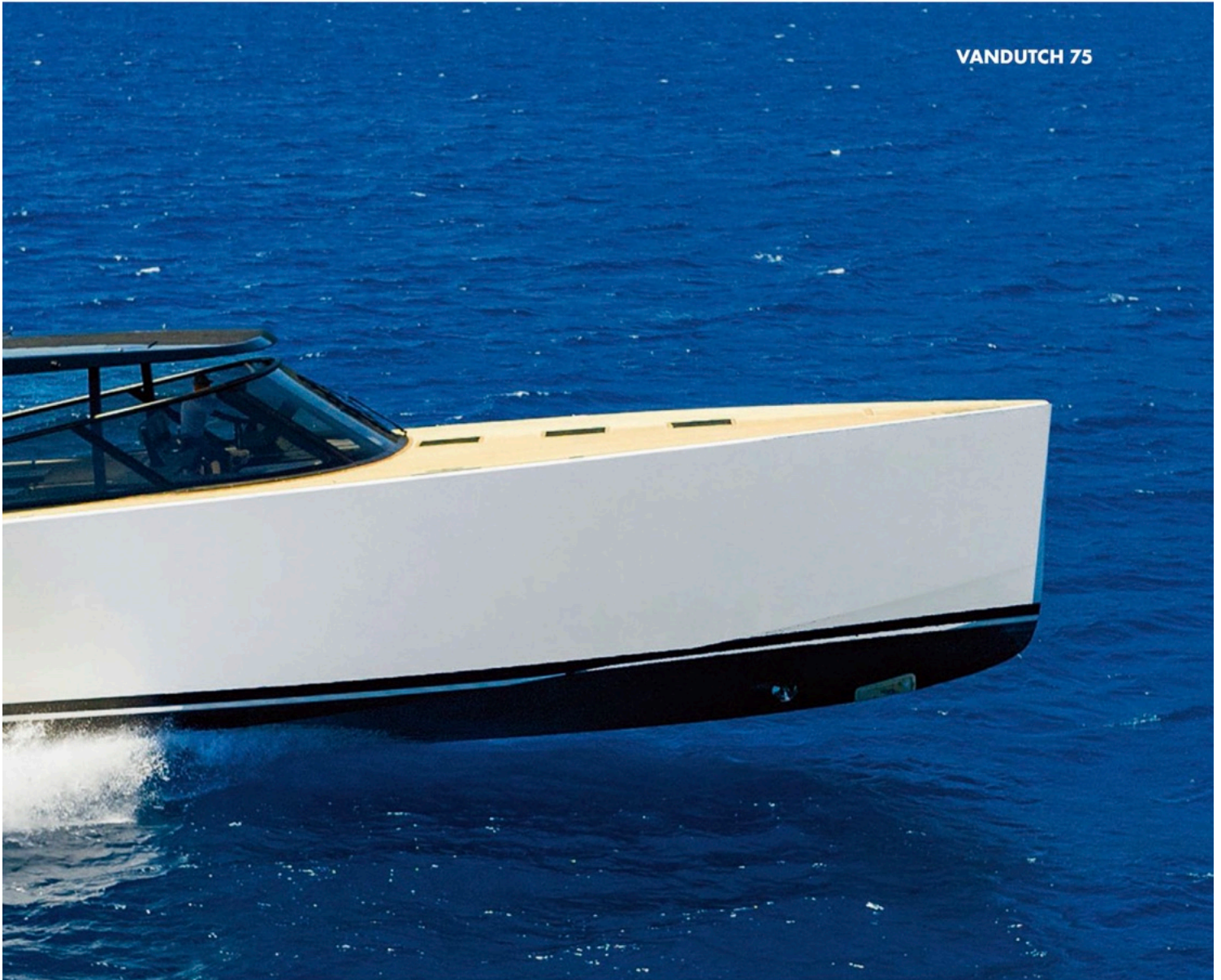
Krafpakets mit bis zu 40 Knoten an ihr Ziel. Die große Windschutzscheibe schützt die Gäste effektiv, das T-Top aus Carbon garantiert Schatten.