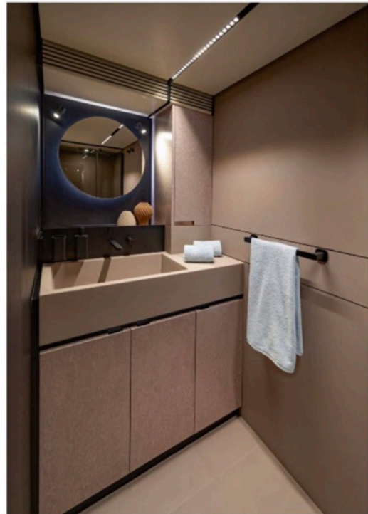
Wohnbereiche: Die VIP-Suite liegt im Bug (l.o.), während die Eigner- und Gästedoppelkabine (l.M., l.u.) achtern des Salons untergebracht wurden. Alle Räume verfügen über eigene Bäder.

womit auch Spritztouren von Cannes an die 200 Seemeilen entfernte Costa Smeralda entspannt möglich sind – acht Stunden bei 25 Knoten und der Espresso im YCCS hat nie besser geschmeckt.