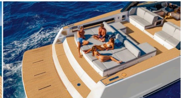
Formschöne Badeinsel: Große freie Deckflächen und Sonnenliegen zeichnen Weekender und Dayboats aus. Auf der hydraulisch absenkbaren Badeplattform parkt bei Bedarf der Jetski, eine Garage unter der Liegewiese nimmt einen Tender auf. Die VanDutch 75 ist für 16 Personen zugelassen.