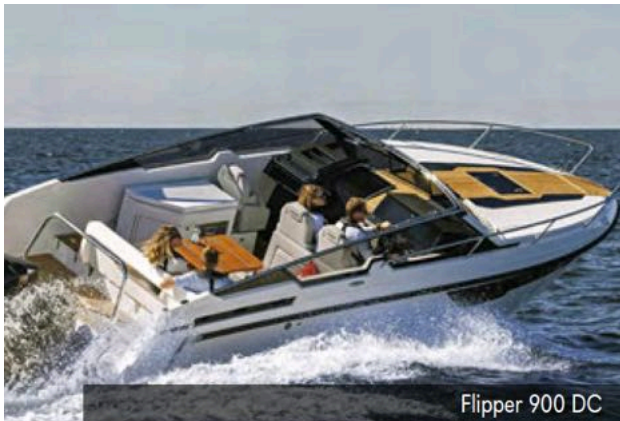
Flipper 900 DC