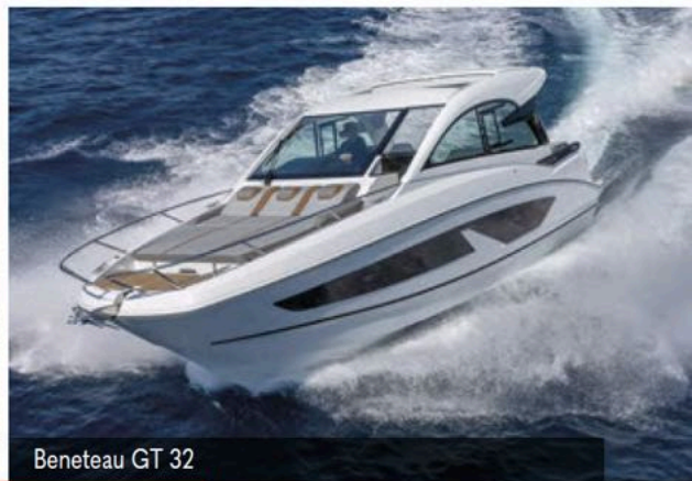
Beneteau GT 32