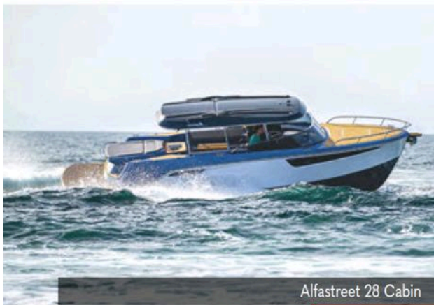
Alfastreet 28 Cabin