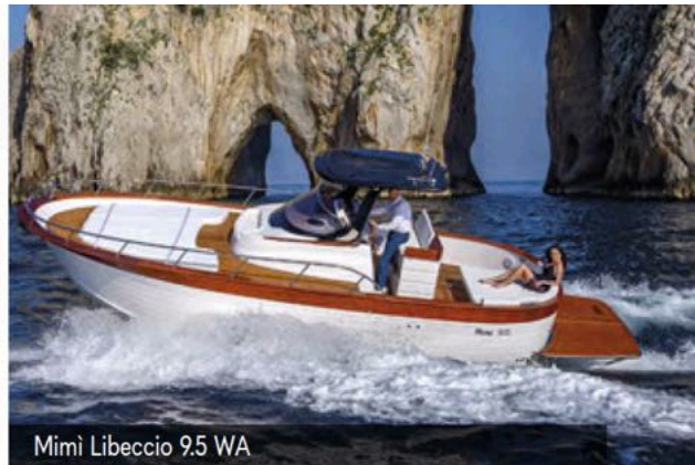
Mimi Libeccio 9.5 WA